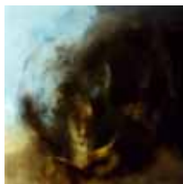
German Portal Barcelona, 1979